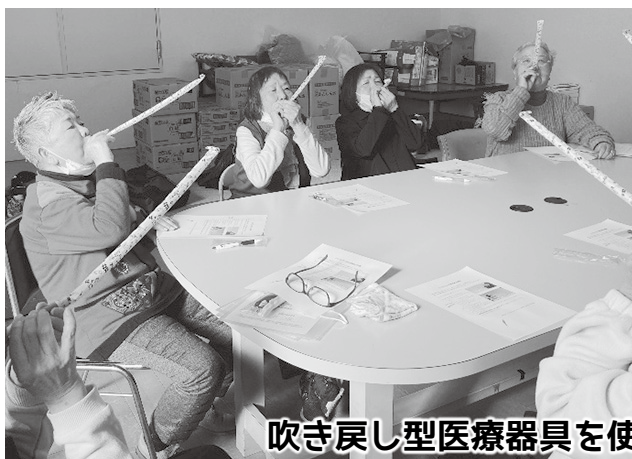
吹き戻し型医療器具を使ったお口のトレーニング

大分県医療生協では「いつまでもおいしく食べて、元気に長生き」を目指し、「お口の機能低下（オーラルフレイル）」予防の取り組みとして、昔懐かしい「吹き戻し型医療器具“長息生活”」を使ったお口のトレーニングの普及を進めています。