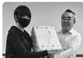
ボウリング大会1位