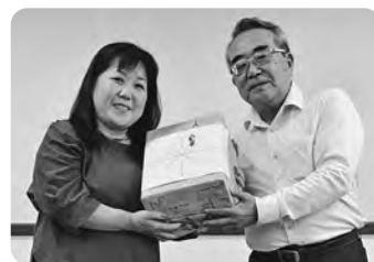
じゃんけん大会優勝