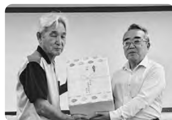
ボウリング大会3位