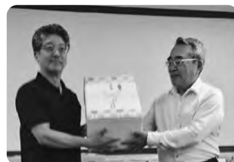
ボウリング大会2位