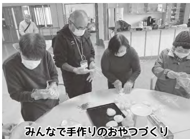
みんなで手作りのおやつづくり