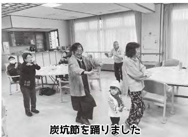
炭坑節を踊りました

社会と多様なつながりのある人は認知症発症リスクが半減という研究報告があります。大分県医療生協では「気軽に参加できる居場所を増やす」ことが地域の健康づくりに繋がると考え、昨年10月に新しい憩いの場として「のんびりカフェ」を開始しました。カフェ2回目の11月には「炭坑節」を踊りました。踊り好きの組合員の「掘って～掘って～、また掘ってー♪」の振り付けの掛け声もあり、踊りが苦手な方も楽しく踊ることができたようです。のんびりカフェでは、おやつを食べたり童謡を歌ったりしながら楽しいひとときを過ごしています。参加者の要望を取り入れこれからもホッとする居場所を作っていきたいと考えています。